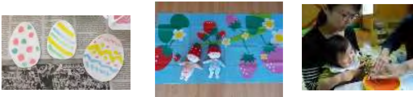
11日 イースターエッグ作り 15日 いちごのお昼寝アート 18・25日 身体測定・手形足型アート